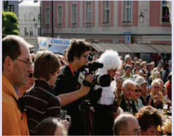
Stadtjubiläum & EM-Finale