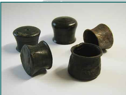
Schröpfköpfe aus Kipfenberg, Manching, Geisenfeld, Nassenfels und Etting

Schröpfköpfe wurden im erhitzten Zustand auf die Haut aufgesetzt. Beim Abkühlen entstand ein Unterdruck, der zur Bildung von Blutblasen oder Hämatomen unter der Haut führte. Hatte der Bader vor dem Schröpfen eine Ader geöffnet, regte der Unterdruck den Blutfluss an. Schröpfen konnte also blutig oder unblutig erfolgen. Oft wurde die Methode auch vorbeugend angewendet.