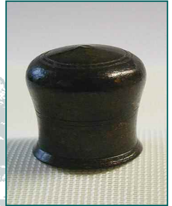
Schröpfkopf aus Kipfenberg

Weitere Schröpfköpfe fanden sich in Manching, Geisenfeld, Nassenfels und Etting. Auch sie stammen aus dem späten Mittelalter (15. Jh.).