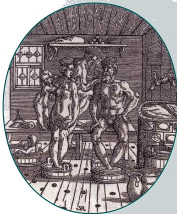
Badestube, beim Schröpfen; Holzschnitt von Jost Ammann n. Paracelsus 1565